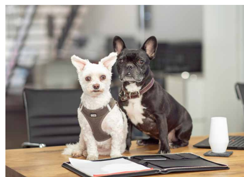
BELLA & RUBI