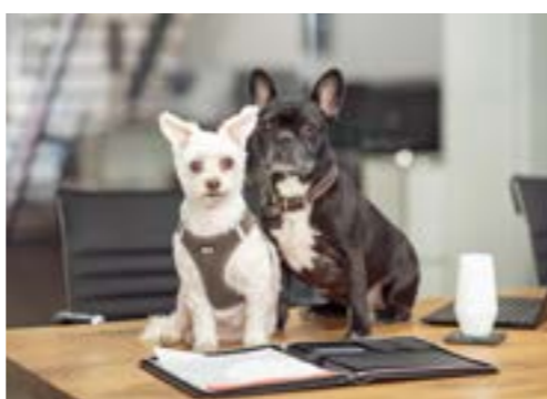
BELLA & RUBI SICHERHEITSDIENST