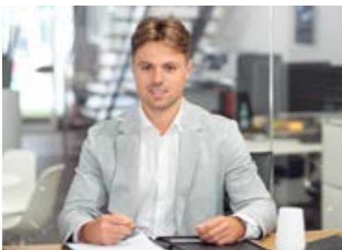
DOMINIK KÖNIG VERWALTUNG & VERKAUF