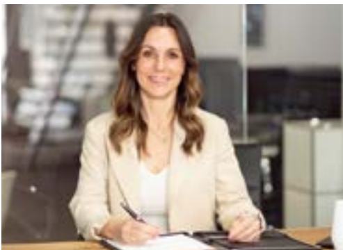
HEIKE GÖRLICH VERMIETUNG & BACK OFFICE